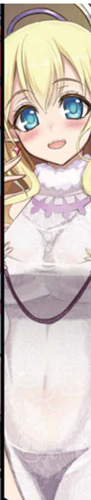
レオハルトの姉で、魔族にして神族の容姿を持つ