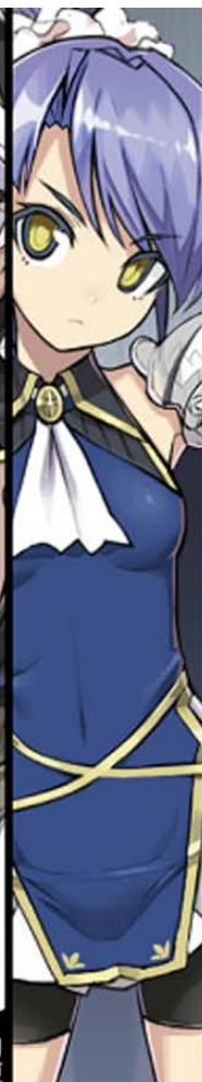
袖希の妹で、最近刃更の家で生活している