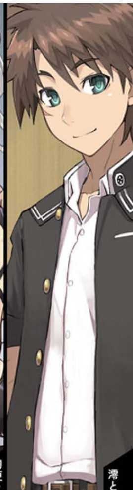
澤と万理亜の兄。特異能力(無次元の執行)の使い手