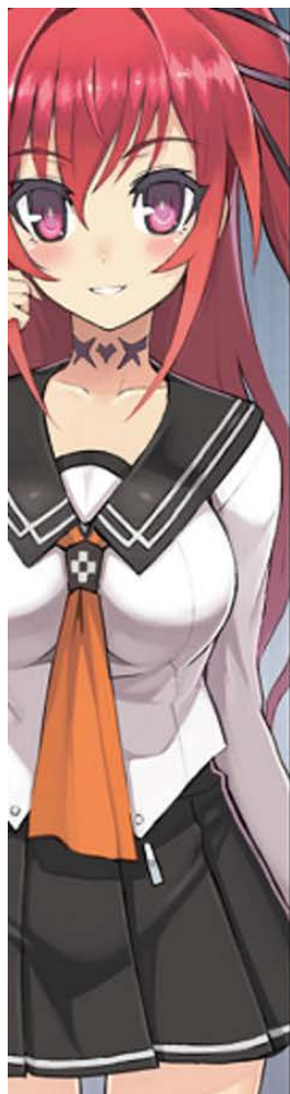
先代魔王の娘で、刃更の妹になった少女 成瀬 滯