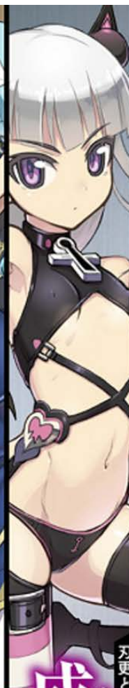
刃更と澤を主従契約させた下の妹。ロリエロサキユバス