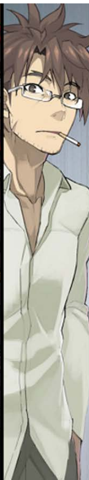
刃更の父で、元・最強の勇者