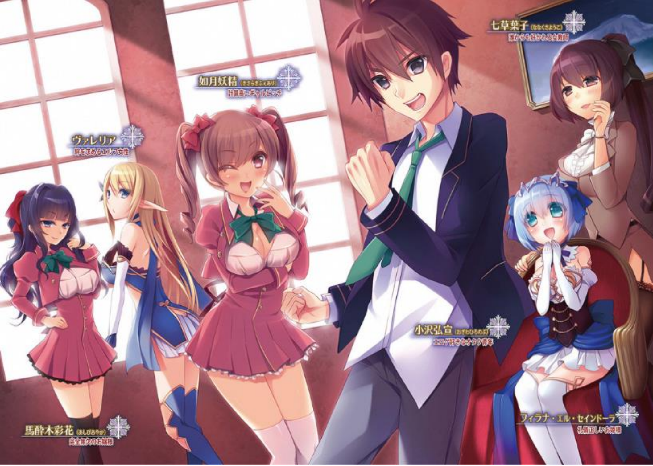
七草葉子 (ななくさあや子) 誰かから助けられる女教師